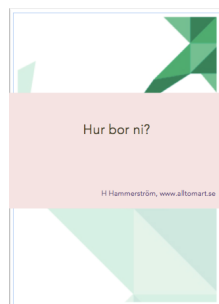
... nätverket och miljön